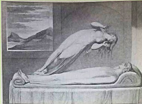
L'Anima si libra sul corpo separandosi riluttante dalla vita. (William Blake, 1808)